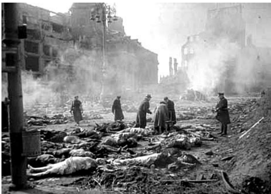
Dresde, el día después...

El primer e indiscutible uso de tecnología bélica que causó muertes masivas e indiscriminadas de civiles se produjo con el bombardeo de las ciudades alemanas durante la II Guerra Mundial 9 . La utilización de bombas incendiarias iniciada en marzo de 1942 contra las ciudades alemanas fue la estrategia adoptada cuando se vio que el bombardeo aliado de objetivos militares alemanes no tenía éxito y que era en cambio muy costoso en términos de pérdida de vidas de aviadores 10 . Jorg Friedrich nos ofrece un relato estremecedor en el clásico informe " Der Brand " 11 . Por ejemplo, el bombardeo masivo de Dresde por las fuerzas aéreas estadounidenses y británicas durante la noche del 13 al 14 de febrero de 1945 ilustra esos efectos. En cuestión de horas perecieron al menos entre 55.000 y 250.000 personas.