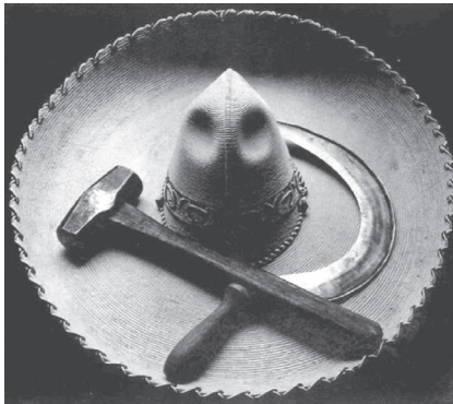
Figura 3. Sombrero mexicano con hoz y martillo , de Tina Modotti, 1927.

un contexto latinoamericano, y la Revolución Mexicana –una guerra campesina por la tierra y el poder– comenzó a ser representada a través de los códigos políticos y estéticos