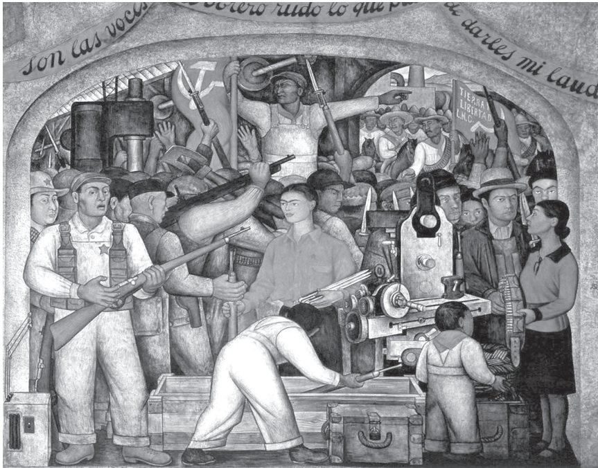
Figura 2. La distribución de las armas (En el arsenal) , de Diego Rivera, 1926 (Secretaría de Educación Pública, Ciudad de México).