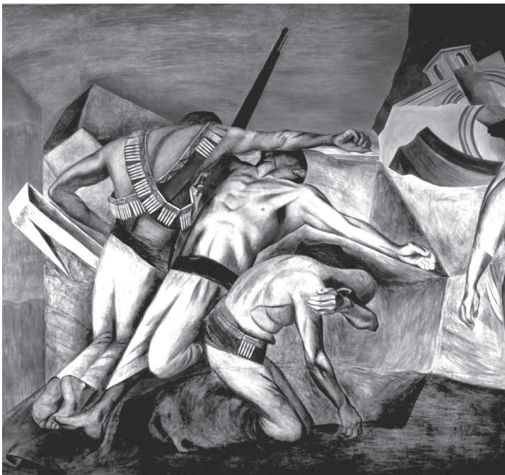
Figura 1. La trinchera , de José Clemente Orozco, 1926 (Patio Grande del Antiguo Colegio de San Ildefonso, Ciudad de México).

El «embrutecimiento» cultural y político engendrado por la Primera Guerra Mundial creó las premisas históricas tanto para el comunismo como para el fascismo e inventó nuevas formas de violencia que se propagaron rápidamente por todo el mundo. En la década de 1920, esta imaginación llegó a América Latina: dentro del panorama intelectual y la vida política, el comunismo se convirtió en un nuevo actor junto al nacionalismo, el populismo y un liberalismo exhausto. Artistas mexicanos como José Clemente Orozco y Diego Rivera pintaron murales titulados La trinchera , en los que las formas europeas de guerra se trasladaban a