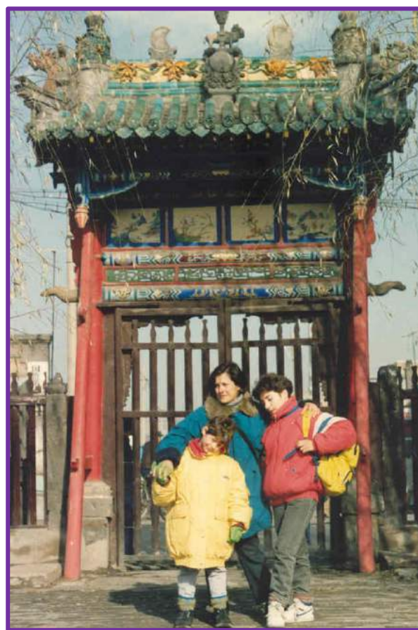
Fotos: Datong, octubre de 1987