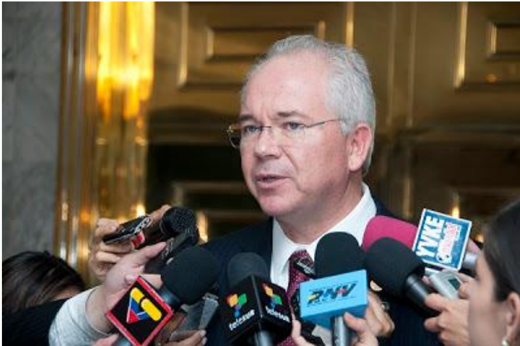
Ministro Rafael Ramírez, rodeado de los micrófonos del Sistema Nacional de Medios Públicos.