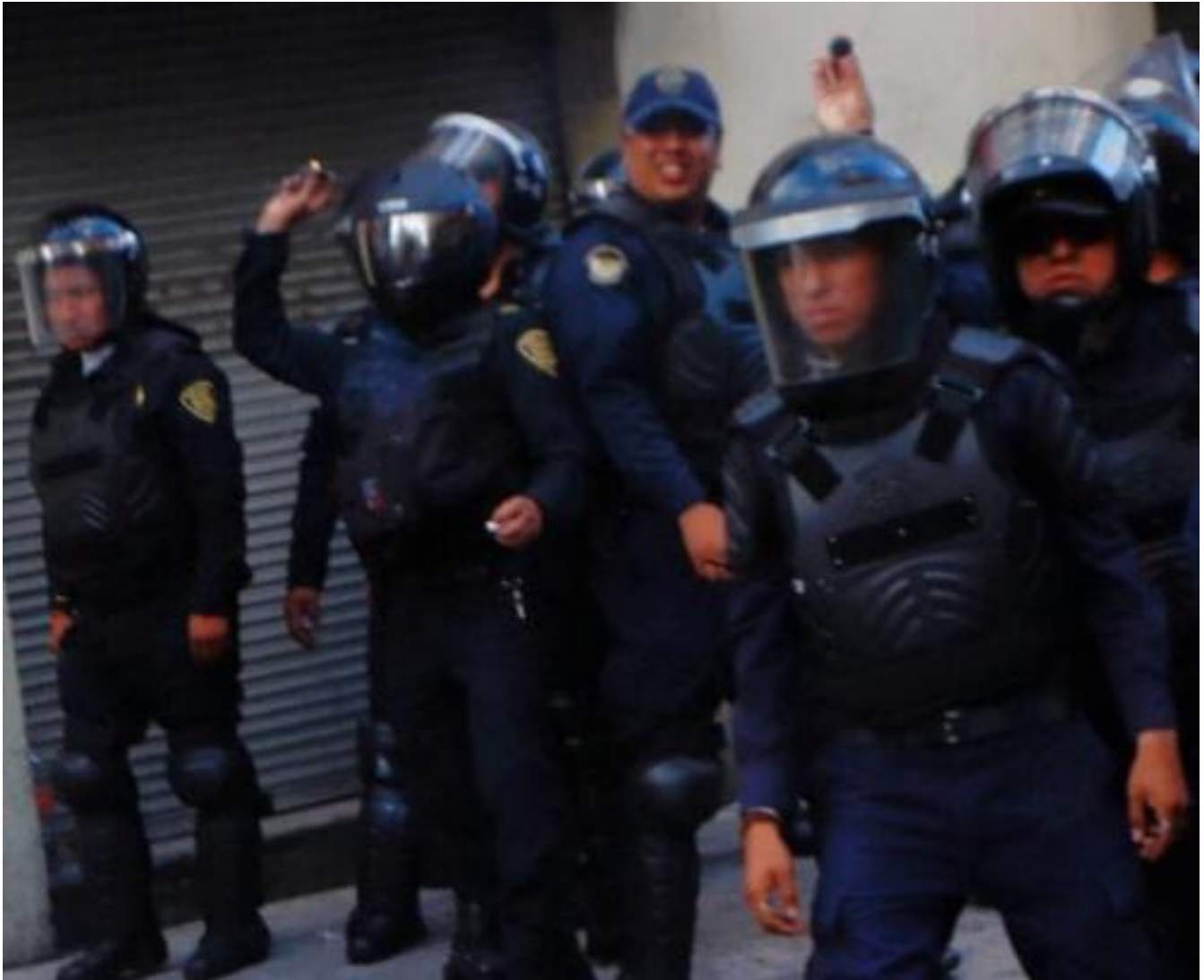
Policias lanzan petardos contra los manifestantes.

contó: "Ya estábamos encapsulados, teníamos miedo, temía por mi vida, a los compañeros los golpeaban y aventaban al piso [...] nunca voy a olvidar la imagen de una chava del bloque que se puso entre el granadero y yo, me gritó PASA, PASA, ella recibía los golpes por mí". Al final muchos fueron lastimados y el susto de pensar que tal vez no saldrían vivos de ahí.