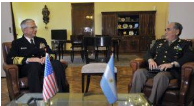
Jefe del Comando Sur, almirante Faller y Jefe del Estado Mayor Conjunto argentino, general Sosa.

En junio, Faller visitó Buenos Aires y ante cadetes de la Escuela Superior de Guerra Conjunta de las Fuerzas Armadas advirtió contra la amenaza de China y Venezuela.