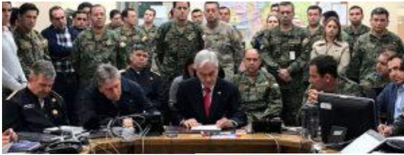
Piñera con militares en Chile