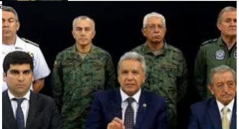
Lenin Moreno con militares en Ecuador