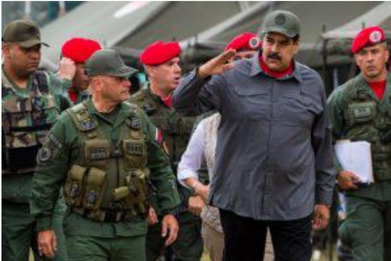
Nicolás Maduro con militares en Venezuela

principal, debido al rol de los organismos defensores de los derechos humanos, que hicieron posible un proceso único en el mundo de Memoria Verdad y Justicia. Estuvieron ahora entre los primeros en repudiar el golpe en Bolivia, y mañana participarán con organizaciones sindicales y sociales en la movilización de respaldo a Evo Morales y denuncia del golpe. Las fotos que siguen son elocuentes: