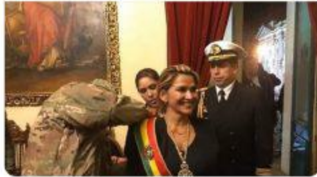
Jeanine Añez con militares en Bolivia