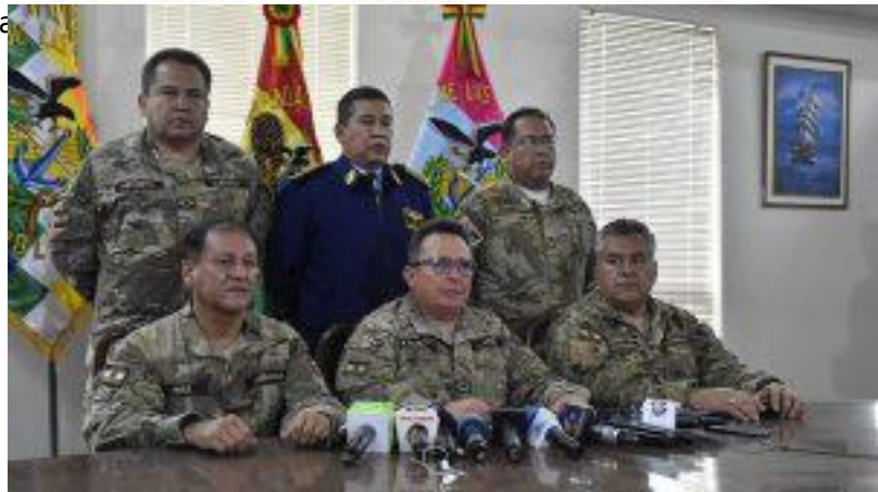
Militares sin Evo en Bolivia